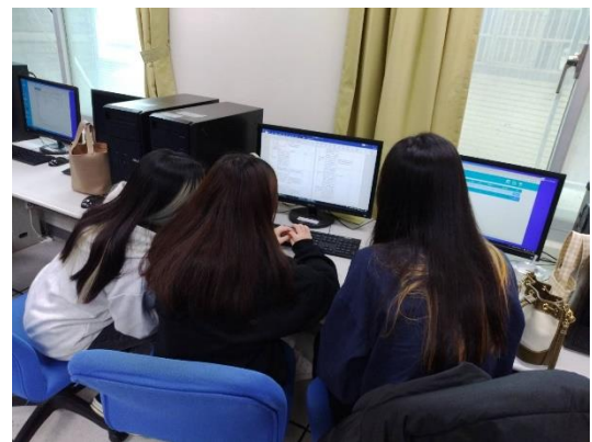
圖 4：討論直播規劃作業