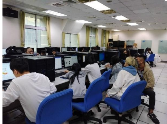
圖 2：小組之間互相觀摩學習