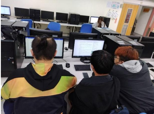
圖 1：討論品牌商品行銷策略作業