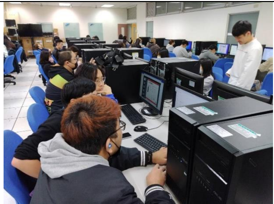
圖 5：全班團隊合作撰寫作業