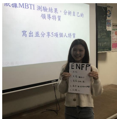
圖 2：MBTI 特質指標檢測