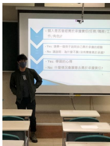
圖 3：經驗分享與報告