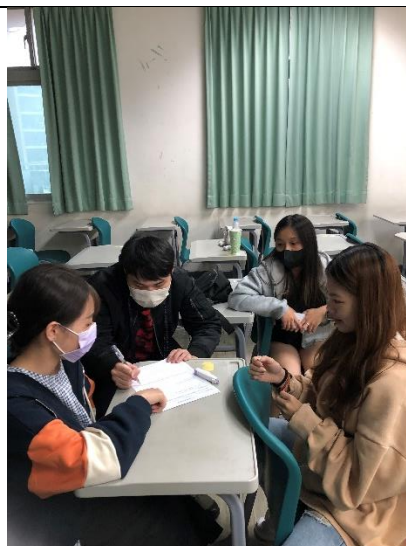
圖 4：分組討論與腦力激盪