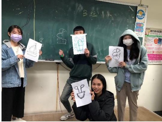
圖 5：團隊活動(創意溝通)成果展現