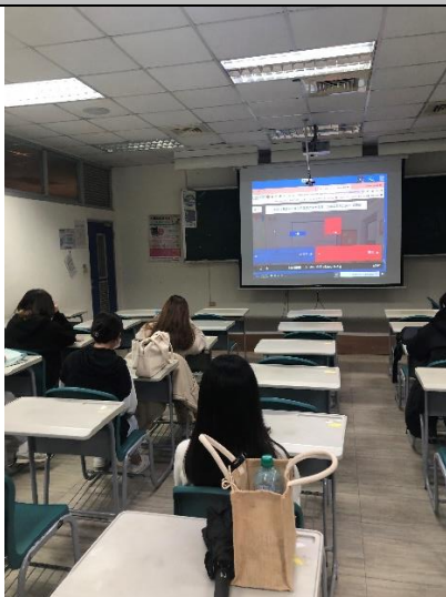
圖 1：互動式遊戲 Kah