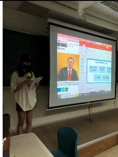
圖 5：魅力領導人物介紹(越南學生報告)