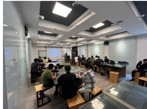
圖 2：各組對報告組別討論