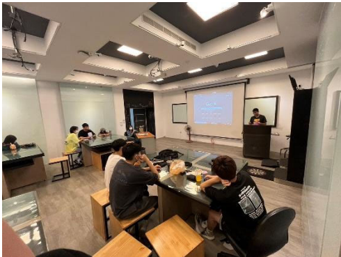
圖 5：成果發表會評論