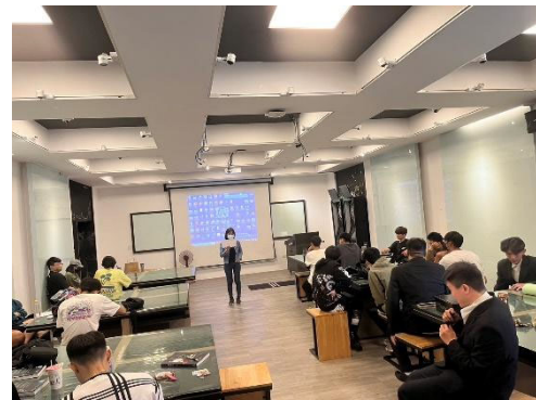
圖 6：成果發表會海報