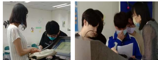
圖 6：學生利用圖版造句後與老師練習口說