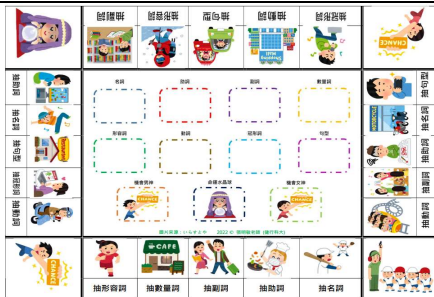
圖 5：上學期之創新教學圖版對照 2