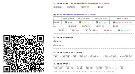
圖 2：講義 QR Code 聯結 Google 雲端共用