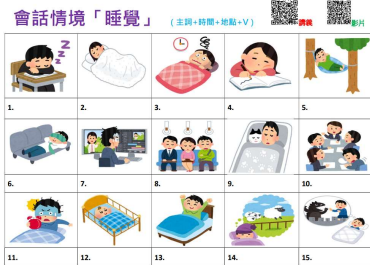
圖 1：本學期創新之日語會話情境圖版