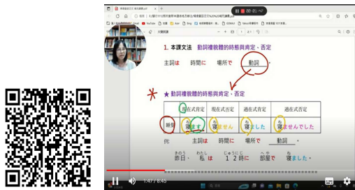
圖 3：影片 QR Code 聯結 Google 雲端共用