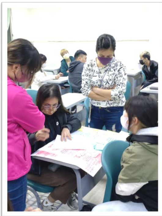
圖 3：學生將資料分類後撰寫大綱