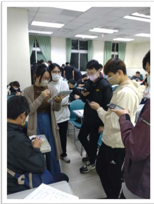
圖 1：學生相互說明資料主題與摘要