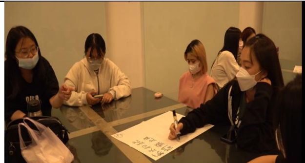
圖 2：同學上課分組討論