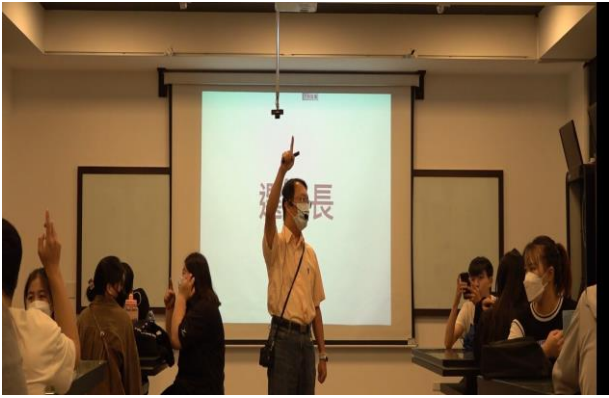
圖 3：利用手指指人法快速選組長