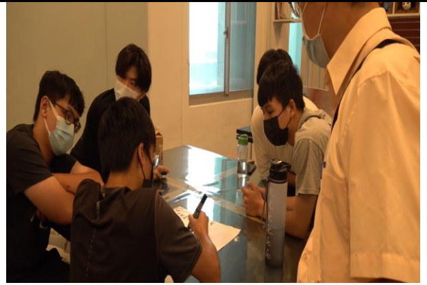
圖 4：老師上課適時引導同學討論