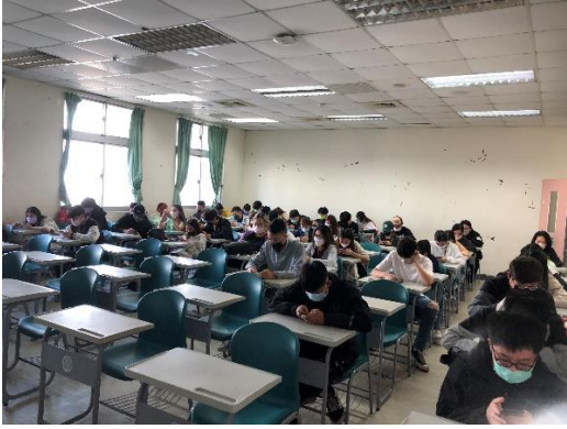
圖 1：上課情形(線上測驗中)