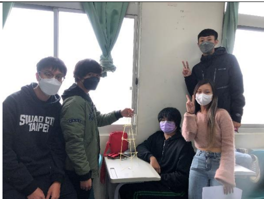
圖 5：團隊競賽成果展示