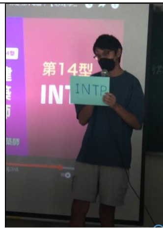
圖 4：學生 上台發表