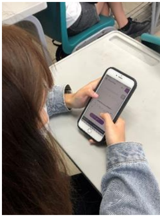
圖 3：填寫表單立即回饋中