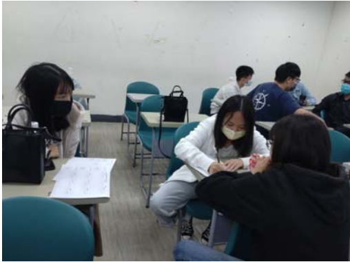
圖 1：團體討論是同儕共學重要環節