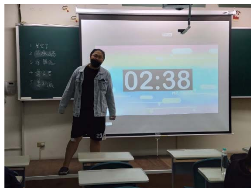
圖 4：每個人至少上台練習一次