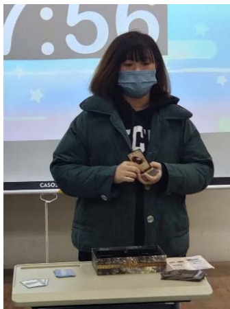
圖 5：策略練習-利用卡牌說明桌遊規則