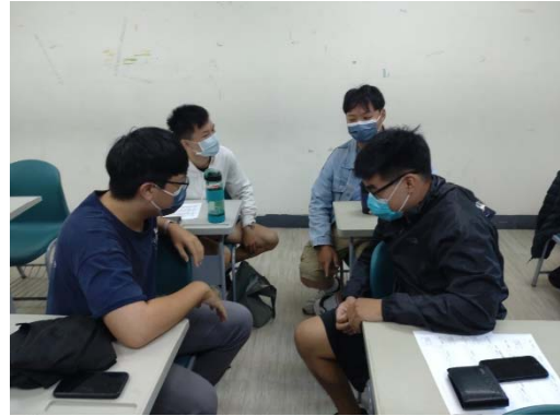
圖 2：團體討論是同儕共學重要環節