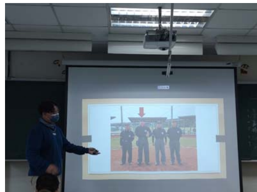
圖 6：期末展演必須綜整學期所學