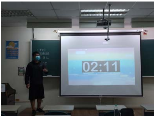
圖 3：每個人至少上台練習一次