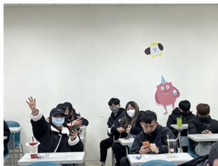
圖 2：小組一起討論找資料共同發表