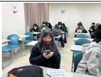
圖 5：ZUVIO 即時互動