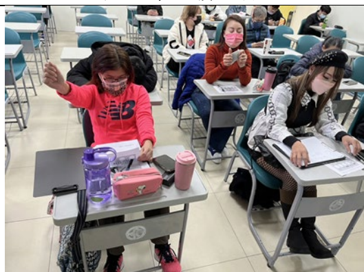
圖 3：學生上課彼此與老師之間皆增加