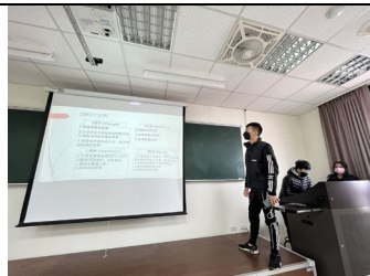
圖 6：小組上台說明想法