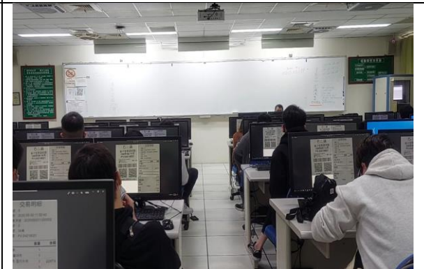
圖 6：石二鍋發票(期末作業 2)