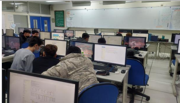
圖 3：分組討論(上機考)