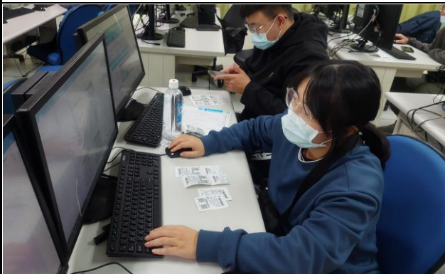
圖 5：7-11 發票(期末作業 1)