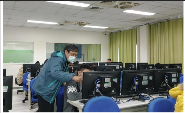
圖 2：老師指導同學解決問題