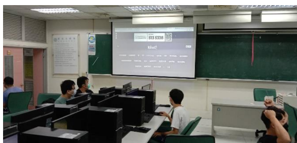
圖 5：利用 kahoo 複習課程狀況