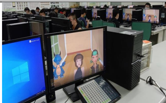
圖 1：利用動畫方式簡介課程