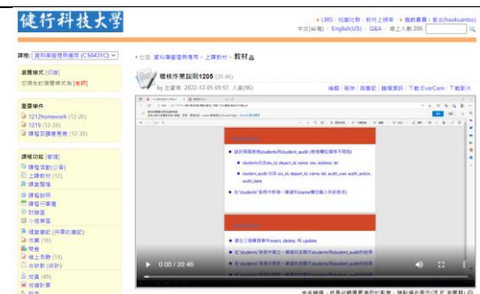
圖 4：上傳錄製影片，方便同學複習