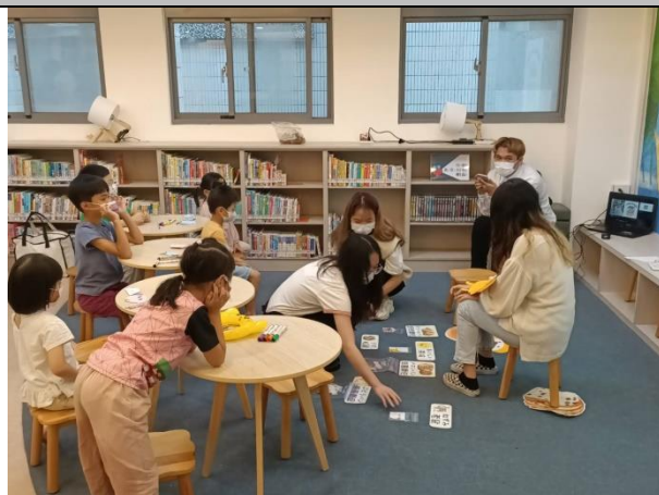
圖 2：10/16 自強分館