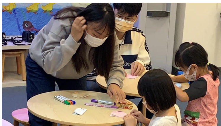
圖 4：10/16 自強分館