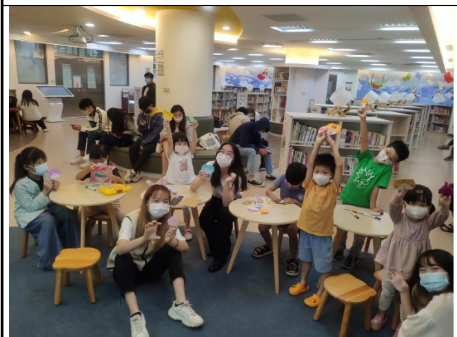
圖 3：10/16 自強分館