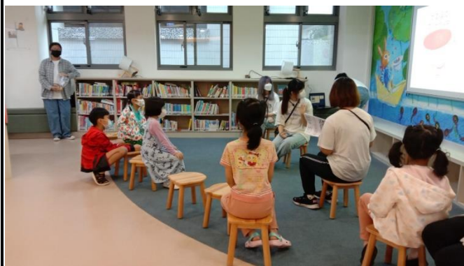
圖 1：10/15 自強分館