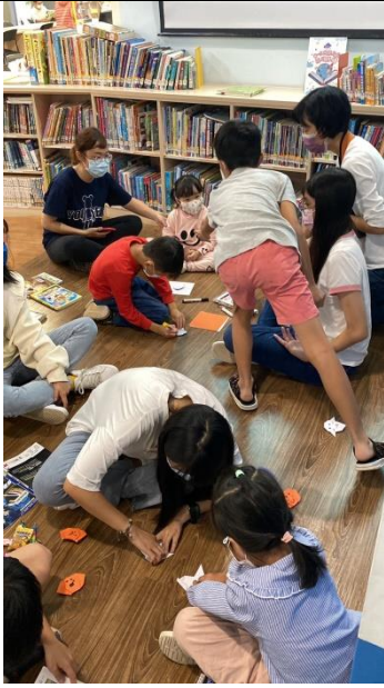
圖 5：10/29 內壢分館