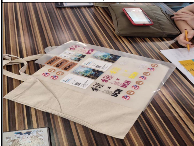
圖 7：學生在創藝中心體驗各種生活用品製作的流程(環保袋)