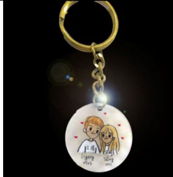
圖 14：學生自製創意商品修圖