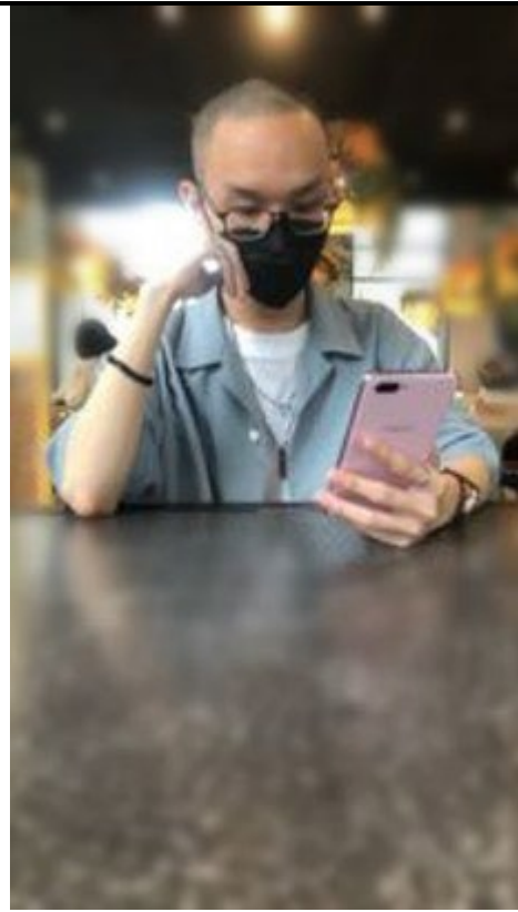
圖 12：學生在人像修圖課程學習修圖