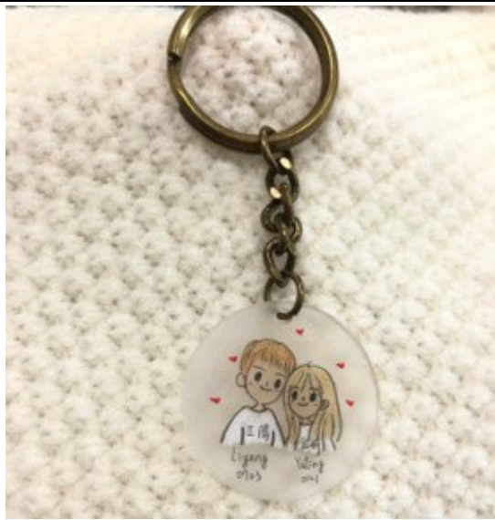
圖 13：學生學習自製商品拍攝