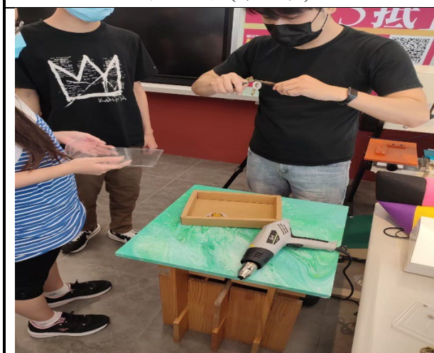
圖 9：學生在創藝中心體驗各種生活用品製作的流程(鑰匙圈)