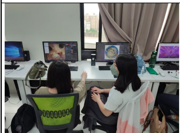
圖 3：學生 u 應用 Photoshop 設計鑰匙圈