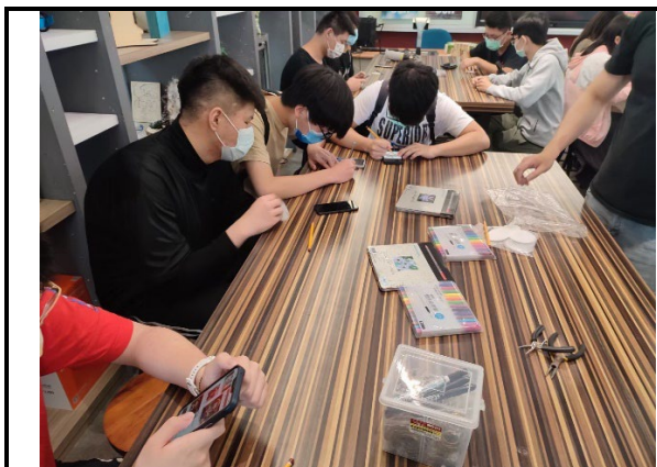
圖 5：學生在創藝中心體驗各種生活用品製作的流程(鑰匙圈)