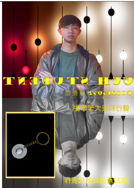
圖 21：學生自我行銷海報設計