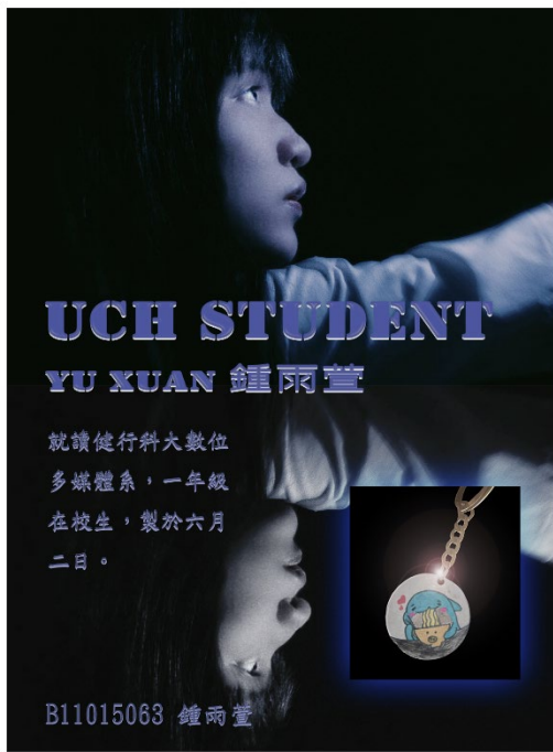
圖 19：學生自我行銷海報設計