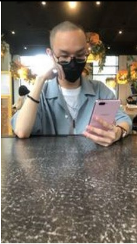
圖 11：學生在人像修圖課程學習自拍