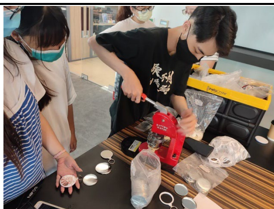
圖 6：學生在創藝中心體驗各種生活用品製作的流程(鑰匙圈)