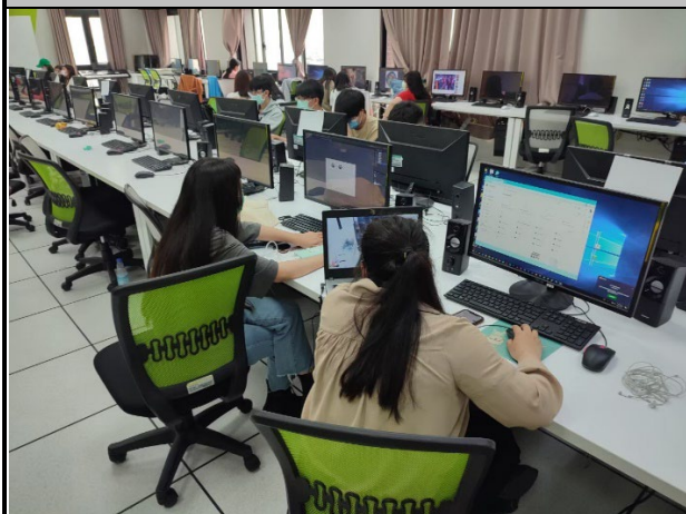
圖 1：學生跟著老師學習使用 Photoshop