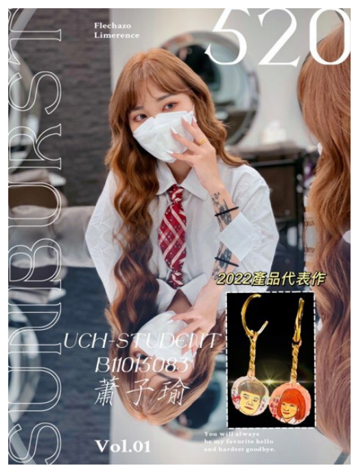
圖 20：學生自我行銷海報設計