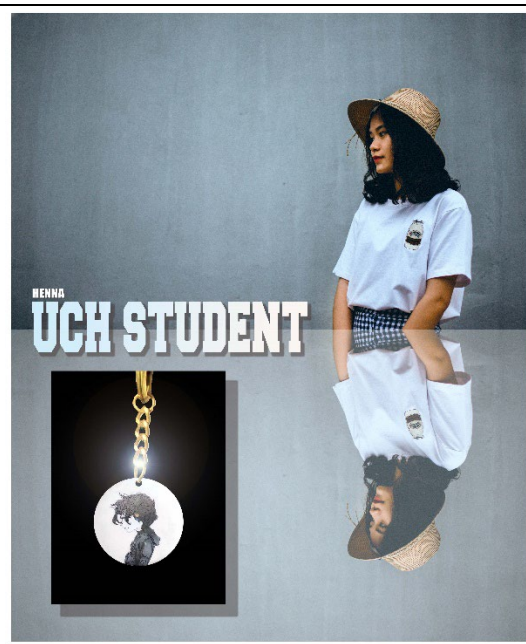
圖 22：學生自我行銷海報設計