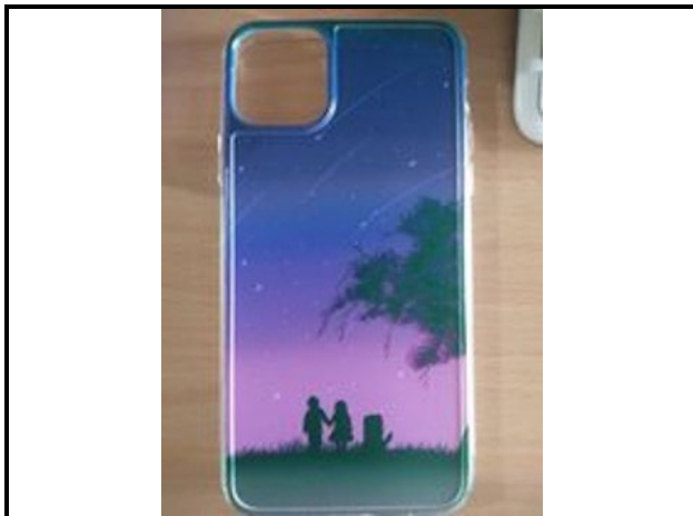
圖 15：學生學習自製商品設計與拍攝