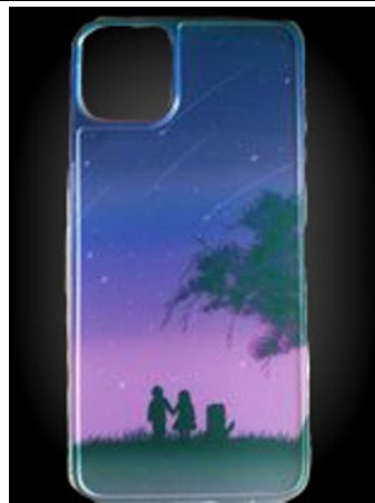
圖 16：學生自製創意商品修圖