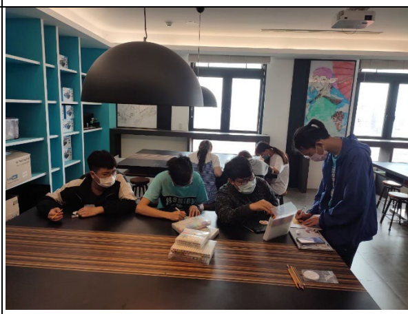
圖 4：學生在創藝中心製作手繪鑰匙圈