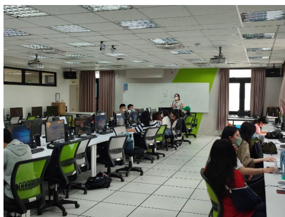
圖 2：老師在電腦教室講解並示範軟體操作技巧，學生學習如何操作 Photoshop