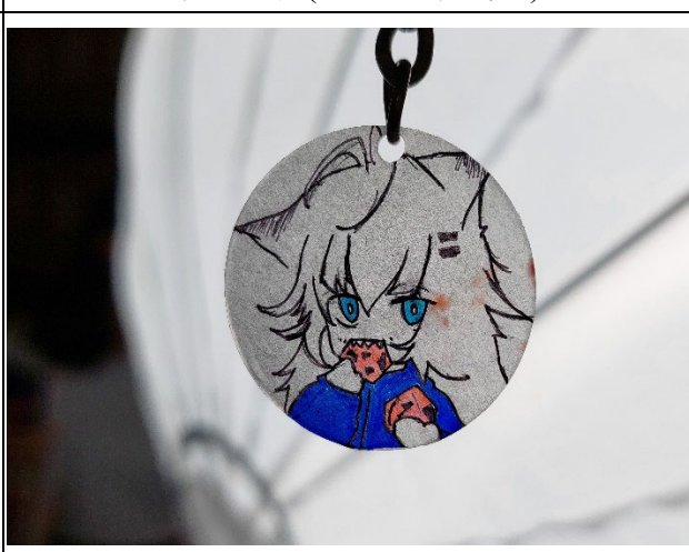
圖 10：學生在創藝中心體驗各種生活用品製作的流程(鑰匙圈成品+打光)