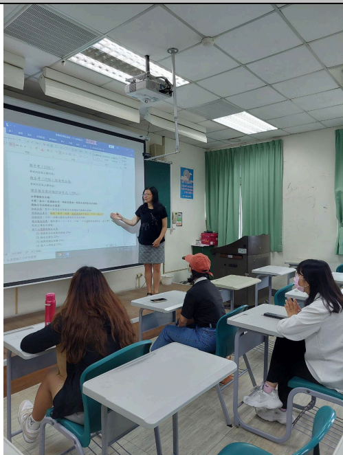
圖 1：說明教學實施方式