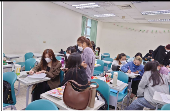
圖 2：小組討論創新創意商品(一)