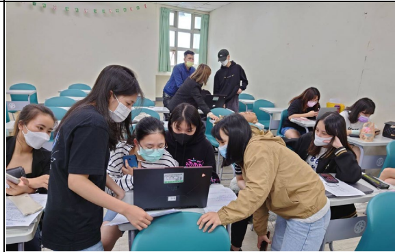
圖 4：小組以筆電製作創新創意企劃書