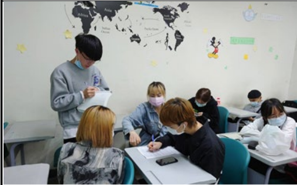
圖 3：小組討論創新創意商品(二)