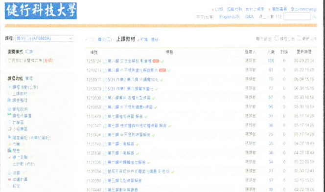
圖 2：課程期間上傳講義、作業、影音檔各 2 次，下載及閱讀人數大幅超過實體上課期間