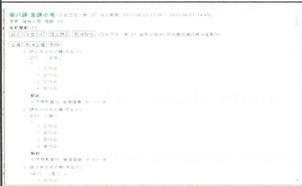
圖 5：線上測驗(選擇題)