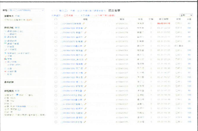
圖 4：學生上傳作業後立即批改、評分、給予意見