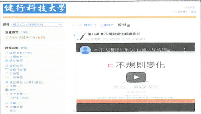
圖 6：YouTube 影音檔，直接在學習平台點閱