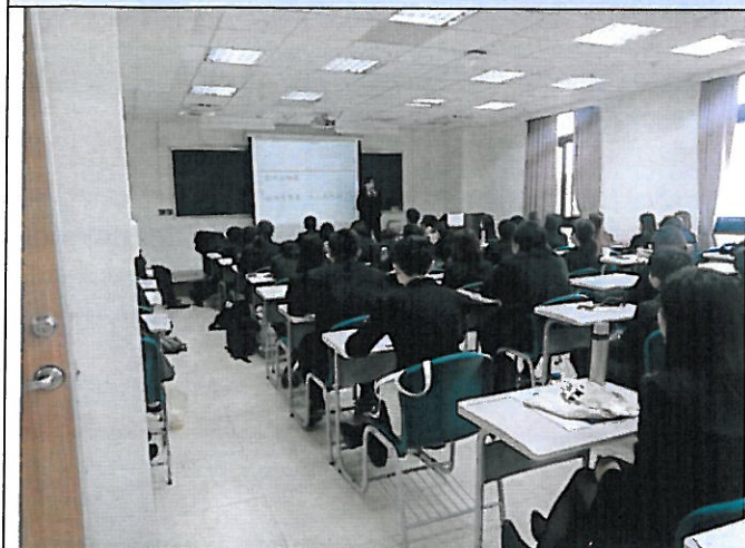
照片說明:實務經驗分享