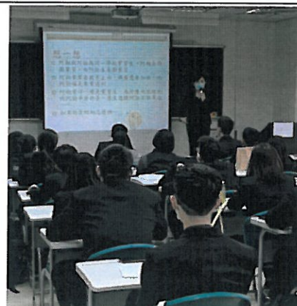
照片說明:講述實習可能遇到的問題