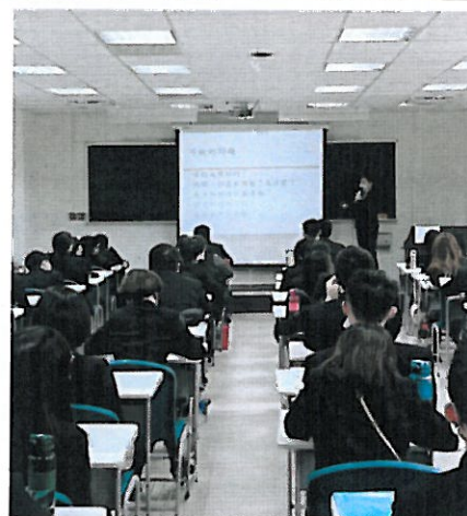
照片說明:講師與學生互動