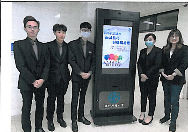
照片說明:師生合影