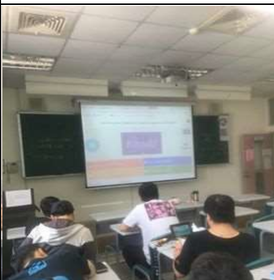
圖 4: Kahoot 來了，趕快用手機搶答