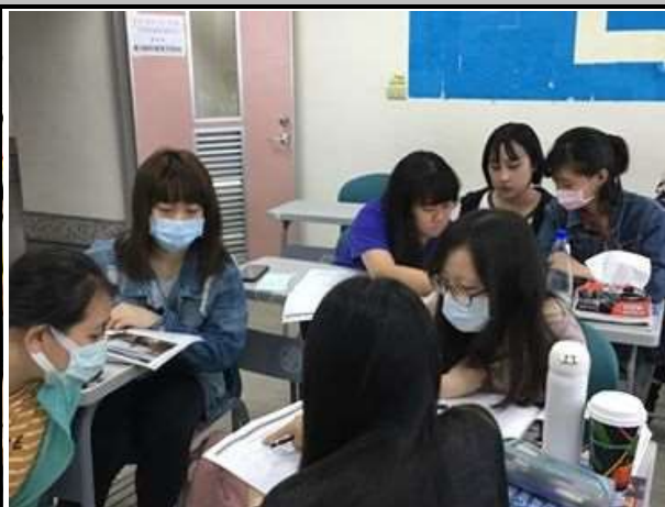
圖 2: 小組討論