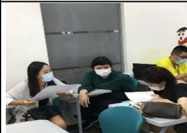
圖 1: 同學於課堂認真討論