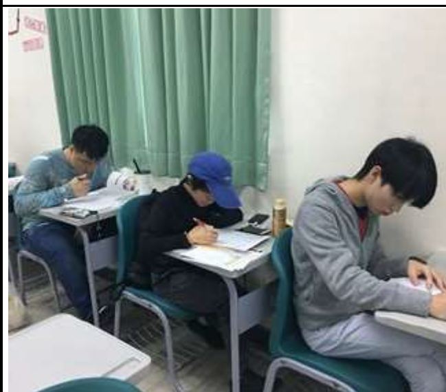
圖 3: 同學認真閱讀